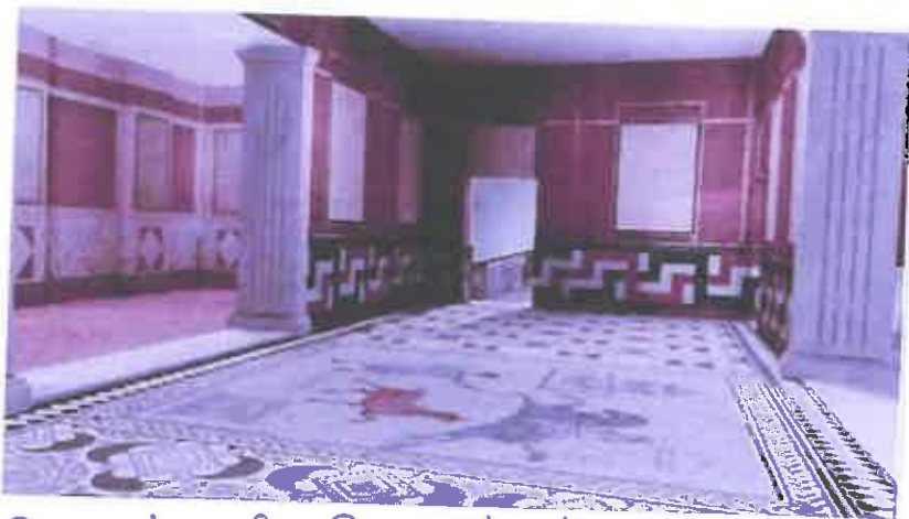
Reconstrucción de antesala