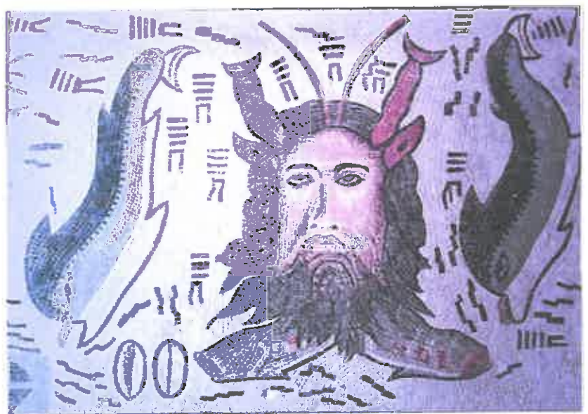
Mosaico do Deus Océano